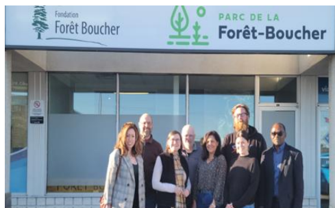
Conseil d'administration sortant

Au-delà des discussions pendant les rencontres du conseil d'administration, les travaux en comité ont été d'un appui considérable et ont contribué à une prise de décision avisée et éclairée.